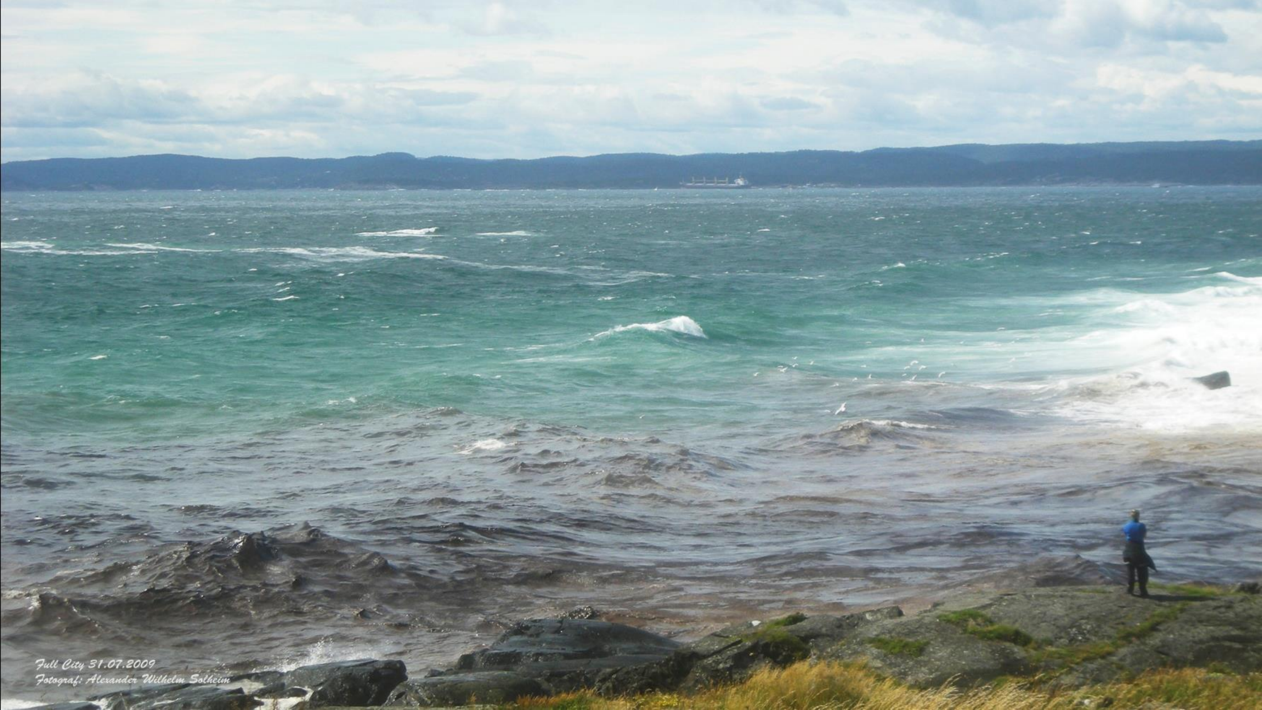
Full City 31.07.2009