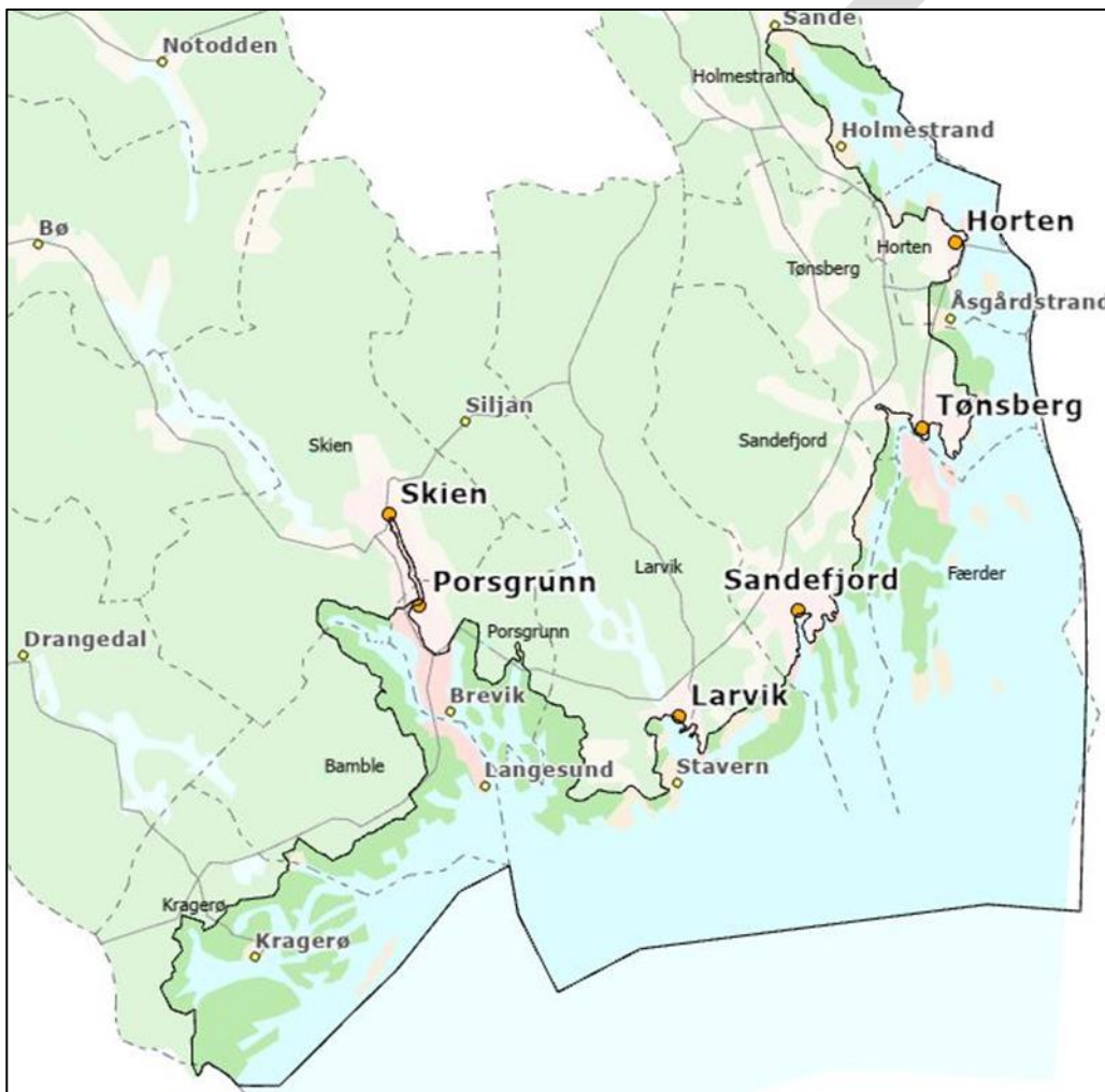
Figur 1: Foreløpig avgrensning av kystsoneplanen

I sjø foreslås det at planområdet utvides i forhold til tidligere plan og planprogram. Begrunnelsen for forslaget er en lovendring i plan- og bygningsloven i 2008 der virkeområdet i sjø ble utvidet i forhold til tidligere lov (fra 1985). Lovendringen fra 2008 gir kommunene adgang til å planlegge en nautisk mil utenfor grunnlinjen, mot tidligere lov fra 1985 som var begrenset til grunnlinjen.